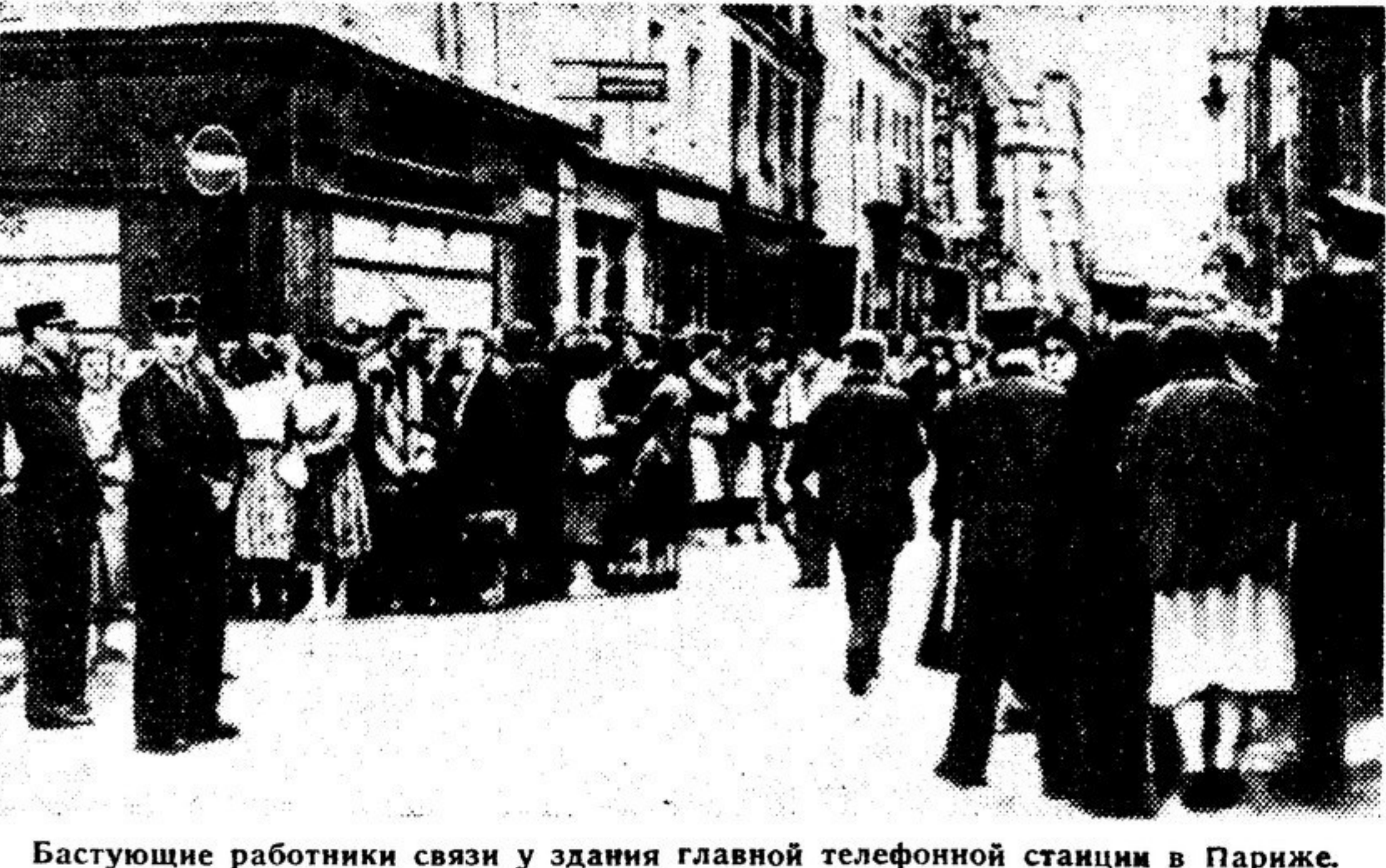
Бастующие работники связи у здания главной телефонной станции в Париже.

Почти три недели охвачена Франция массовым забастовочным движением. Во многих городах в эти дни смолкли заводские и фабричные гудки, прекратилось движение на транспорте, служащие покинули свои учреждения. Если назвать все города и местечки, которые были охвачены забастовками, придется упомянуть почти все без исключения департаменты Франции.